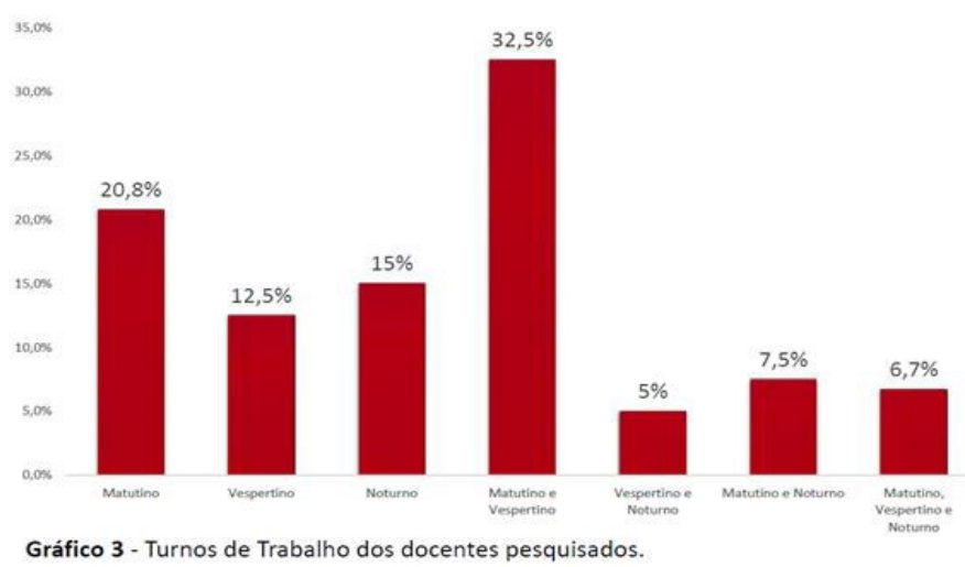
FIGURA 3. Percentual de docentes por turno de trabalho

No que se refere aos turnos de trabalho, foi perceptível que, de maneira em geral, 32,5% dos pesquisados trabalham em dois períodos, sendo os mais citados, o período matutino e vespertino (Figura 3).